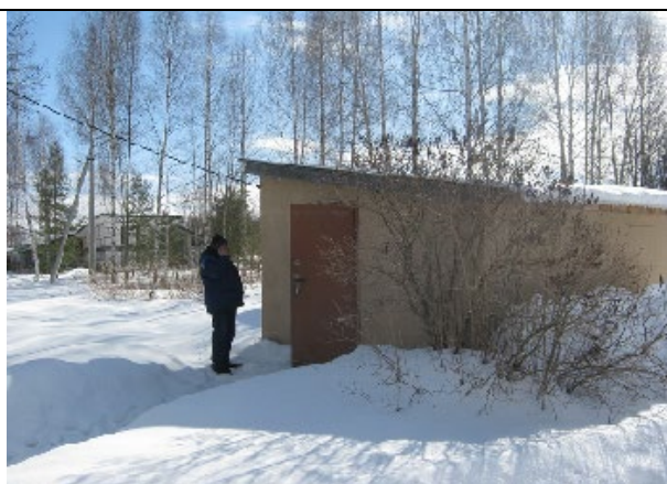
Павильон скважины № 2873 д. Задубье