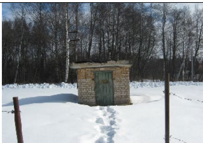
Павильон скважины № 3942 д. Средняя