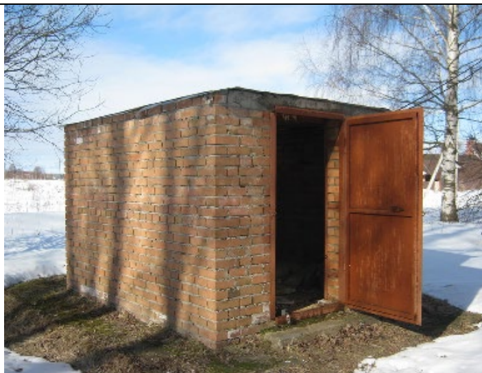
Павильон скважины д. Средняя