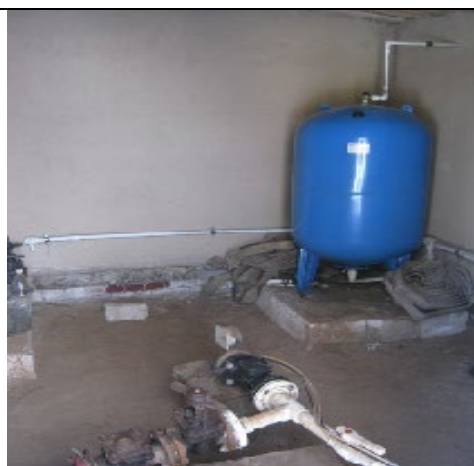
Накопительный бак для летнего периода