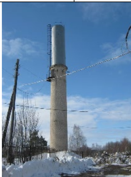
Водонапорная башня д. Становщиково