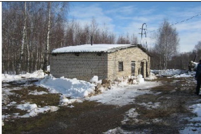
Павильон скважины № 1221д. Становщиково