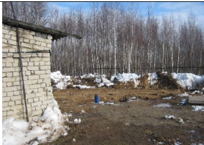
Новая скважина 2021 года