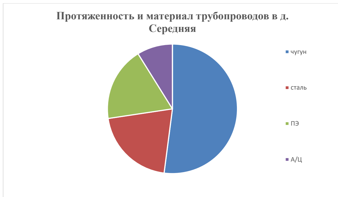
Рис 1.5.3. Протяженность и материал трубопроводов в д. Средняя

Водоразборные колонки и гидранты приведены в таблице 1.5.3.2, информация представлена специалистами администрации сельского поселения.