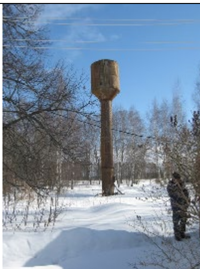
№ 2873 д. Задубье водонапорная башня в зимний период

Неравномерность водопотребления в д. Средняя, д. Лежнево, д. Симаково и д. Становщиково регулируется существующими водонапорными башнями объемом 46 м 3 .