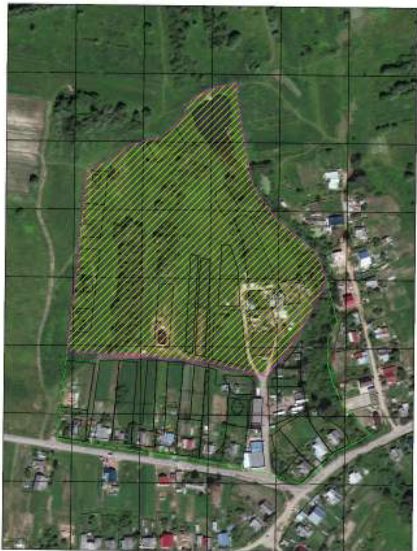
Схема ориентировочных границ территории, в отношении которой осуществляется подготовка проекта межевания